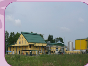
Otvorena Tvornica biodizela Europa Mill