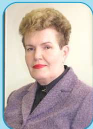
Predsjednica Zdenka Buljan, HDZ