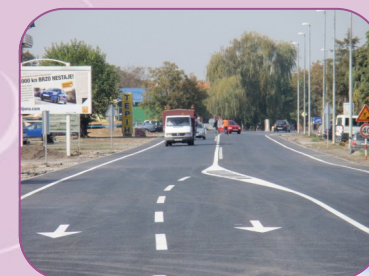
Završena kružna regulacija prometa na Trpinjskoj cesti