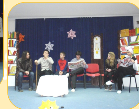
Božićna priredba Doma učenika u Pastoralnom centru sv. Bono u Vukovaru, 17. prosinca 2009.