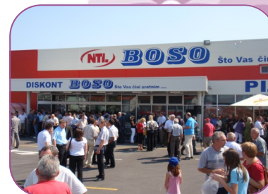
Otvoren Diskont Boso na Mitnici