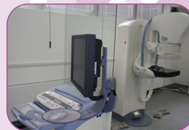
Novi mamografski uređaj u OB Vukovar