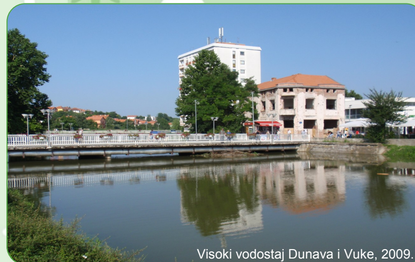
Visoki vodostaj Dunava i Vuke, 2009.