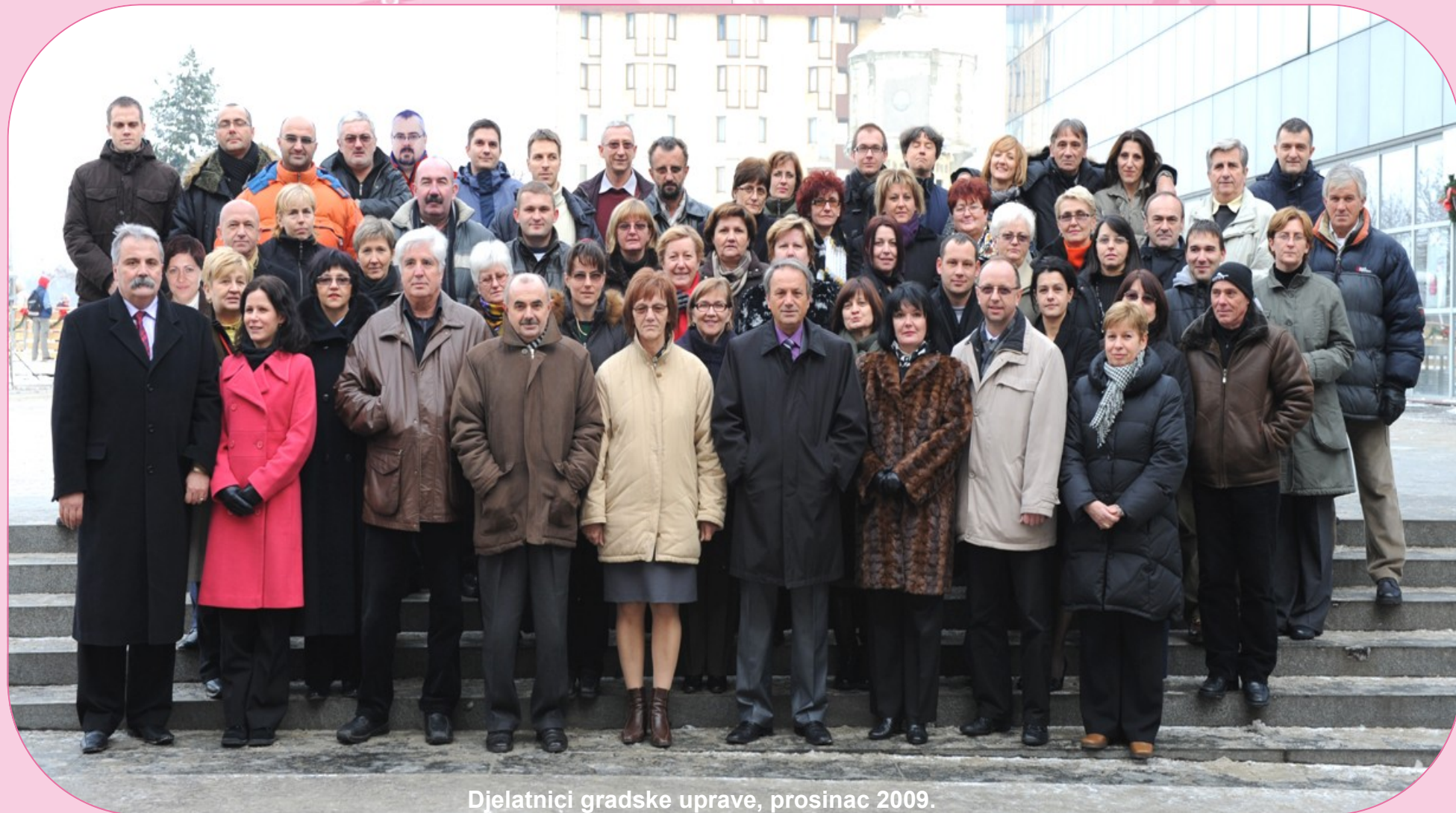
Djelatnici gradske uprave, prosinac 2009.