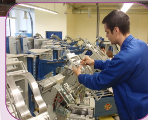
Obnovljena Obučara Borovo